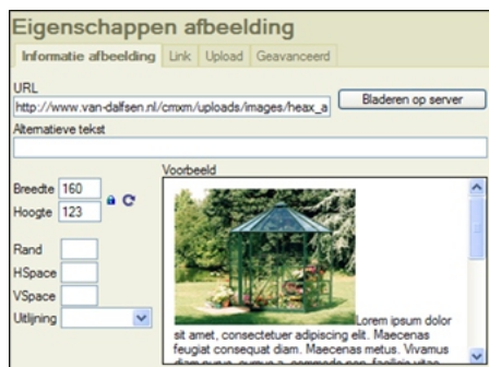
Eenvoudig foto's uploaden en plaatsen op de website