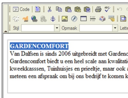
Uitgebreide tekstmogelijkheden met wysiwyg-editor

Voor uw website leggen wij alle te gebruiken lettertypen en kleuren vast in een zogenaamd stylesheet. Ook maken wij voor de meeste klanten een aantal templates aan voor het gebruik op de pagina's. Denk hierbij aan een tekstblok met foto's rechts op de pagina. Door deze hulp kunt u, of de mensen die u heeft aangesteld, uw website eenduidig vorm geven en de stijl in stand houden !