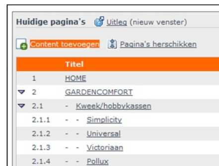
Onbeperkt pagina's aanmaken en bewerken